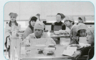
災害時の非常持ち出し品を確認。協会HPにも掲載している「命の手帳」を見ながら、ひとつひとつチェックしました。