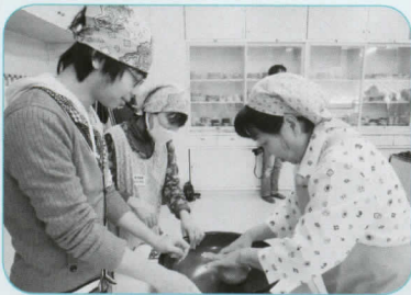
そば粉に水を少しずつ入れ混ぜるところから始めました。

そば作りの後は、災害に備えるための講話。非常持ち出し品と避難所を確認し、家族との連絡方法を決めておくことなどを話し合いました。