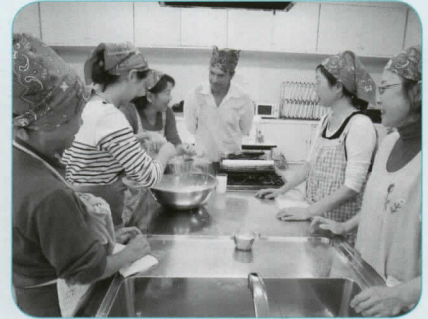
「僕の息子たちも時々手伝ってくれますよ。来年の母の日には、皆さんのお母さんにとってあげてくださいね。」