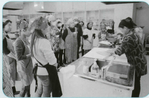
めん棒を使い、生地を四角形にのばすのは難しいですね。